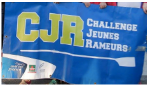
CJR PAGE 1