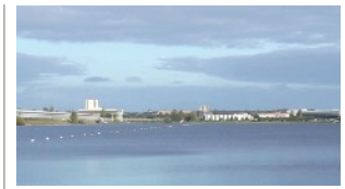
CHALLENGE MICHEL ANDRIEUX