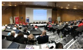
ASSEMBLÉE GÉNÉRALE PAGE 2