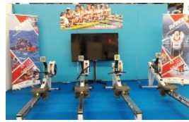
SALON DES SPORTS PAGE 3